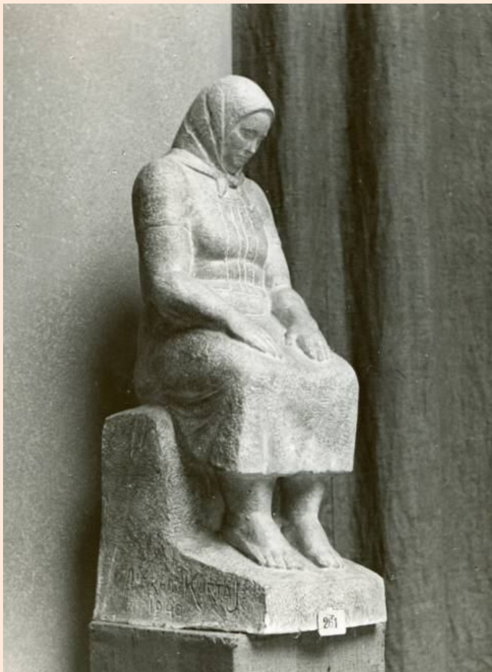
Öregasszony 1939 (elpusztult)