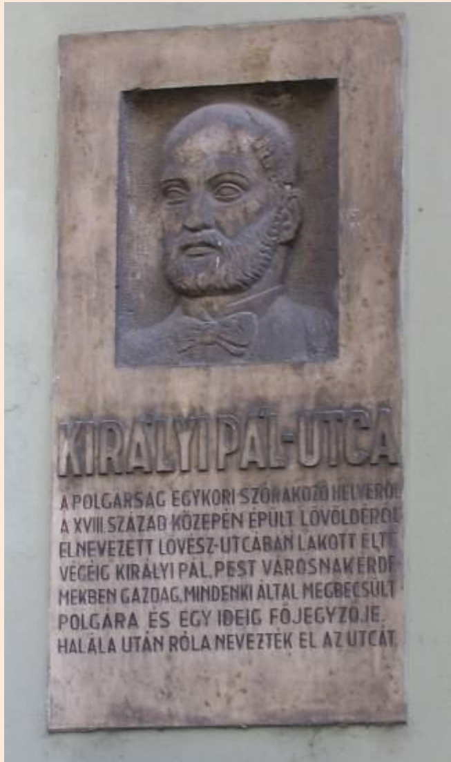
Budapest, Királyi Pál utca 2.

Ezek után rengetek emléktáblát készített, amelyek településeink köztereit, utcáit, közintézményeit ékesítik.