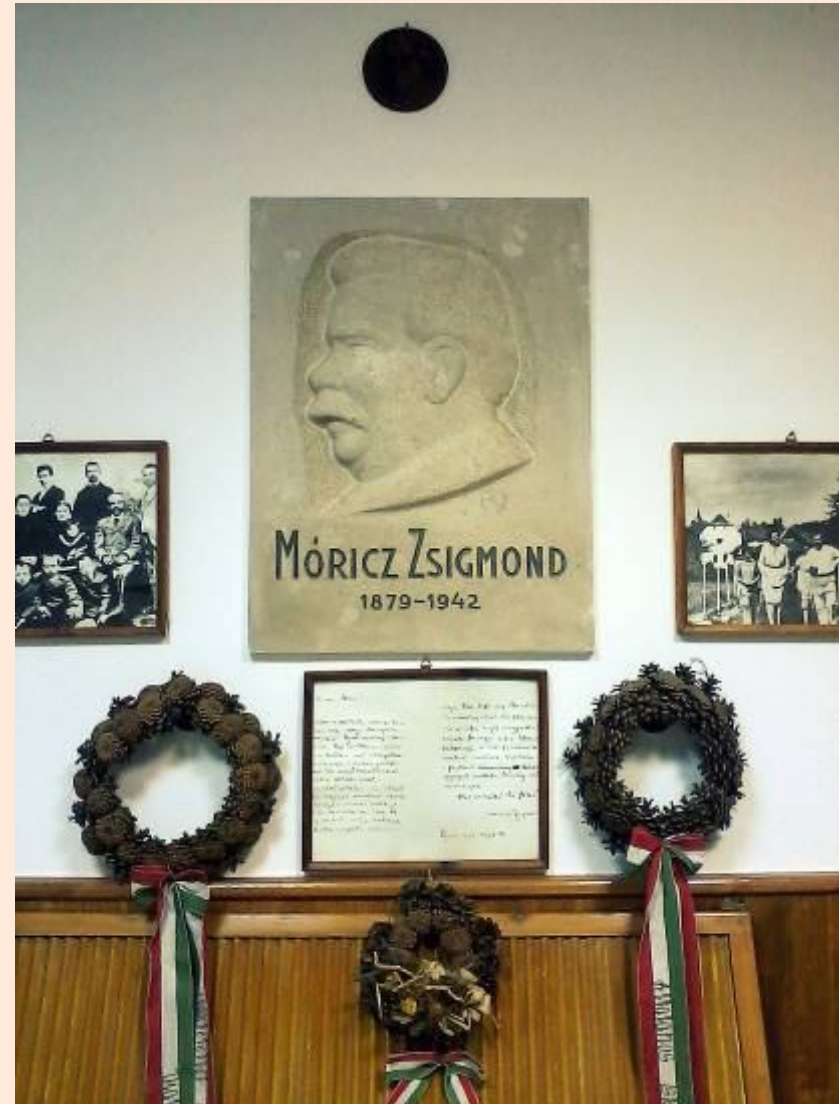
Mórícz Zsigmond kollégium, Sárospatak