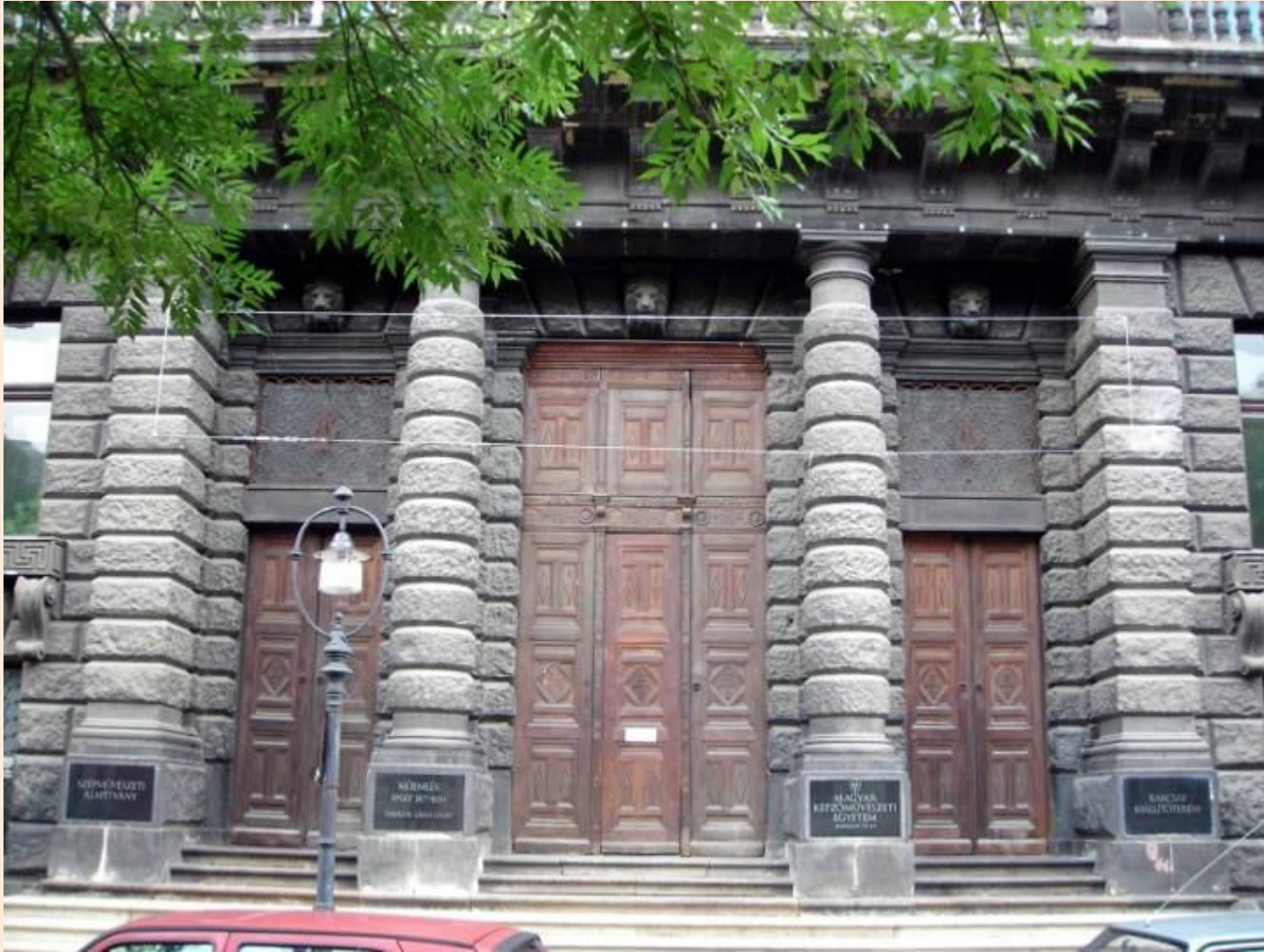
Magyar Képzőművészeti Egyetem, Budapest